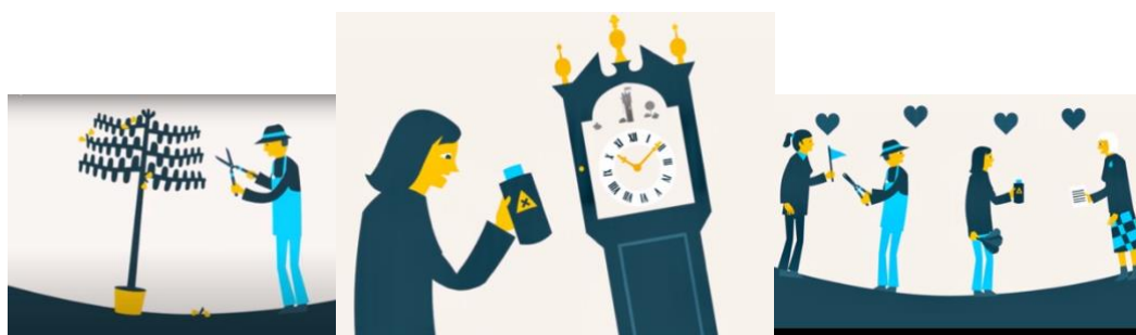
(Scènes uit het introductiefilmpje van Leer je Erfgoed)

In 2020 heeft de NMo bijgedragen aan de ontwikkeling van het platform door deelname in de Stuurgroep en de Projectgroep, de productie van een businesscase en een module en het voeren van gespreken met vertegenwoordigers van het monumentenveld met het oog op wensen en mogelijke deelname. Rond Open Monumentendag werd de komst van Leer je Erfgoed wereldkundig gemaakt met onder meer een speciaal voor het platform ontwikkeld filmpje: https://youtu.be/VWlyl9e7yKY .