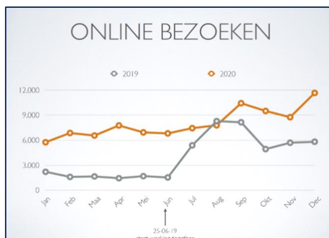
De online bezoeken aan het Monumentenportaal in 2020, vergeleken met 2019

Naast communicatie over het portaal op sociale media (LinkedIn, Facebook, Instagram), werd in 2020 opnieuw met behulp van het bureau INTK ingezet op het vergroten van het aantal bezoekers van het portaal. Dit bureau zet op professionele wijze de Google Grants in die aan de NMo als ANBI beschikbaar is gesteld. Deze inzet heeft in 2020 geresulteerd in ruim 96.200 bezoeken aan de website van het Monumentenportaal. Dit is een verdubbeling (+99%) ten opzichte van 2019 en komt neer op gemiddeld ruim 8.000 bezoeken per maand. De bezoekersaantallen waren in december 2020 het hoogst: deze maand werd afgerond met 11.650 bezoeken. De gemiddelde tijd die bezoekers in 2020 spendeerden op het portaal is lang: meer dan 3 minuten.