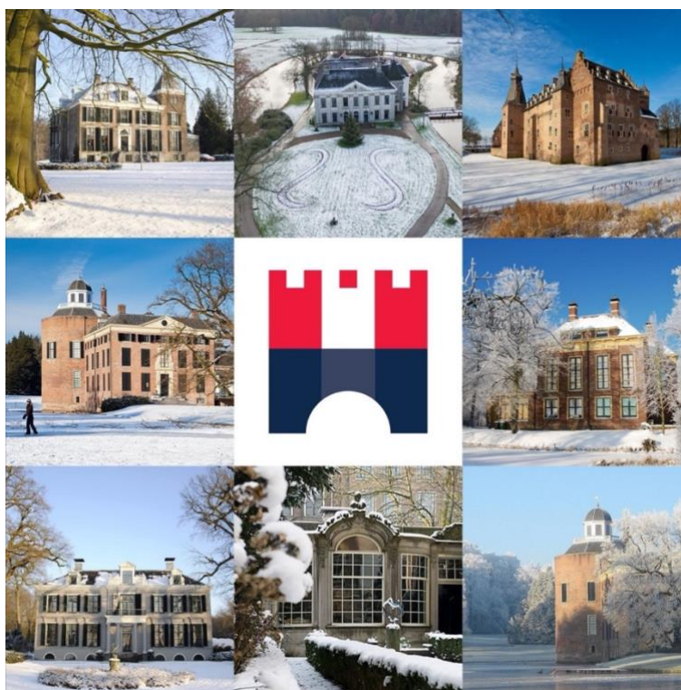
Kerstkaart met foto's van monumenten van onze leden

Doelen voor 2021 zijn een ledenenquête uit te voeren om feedback te verkrijgen over bestaande en nieuwe initiatieven voor de leden.