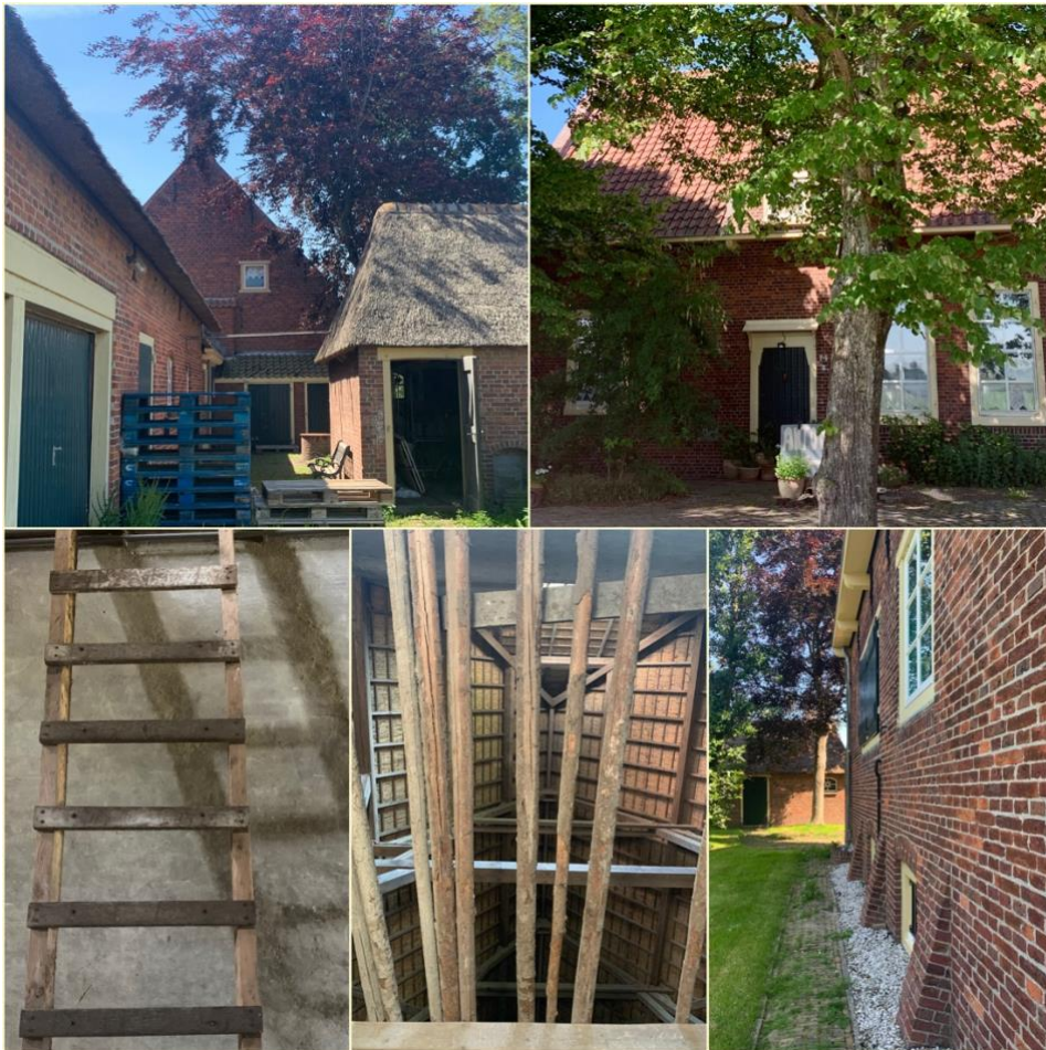
De 'Mariahoeve'

De 'Mariahoeve' is zonder bruidsschat is overgedragen omdat de hoeve over eigen inkomsten uit pacht beschikt, waaruit het onderhoud van het ensemble kan worden bekostigd.