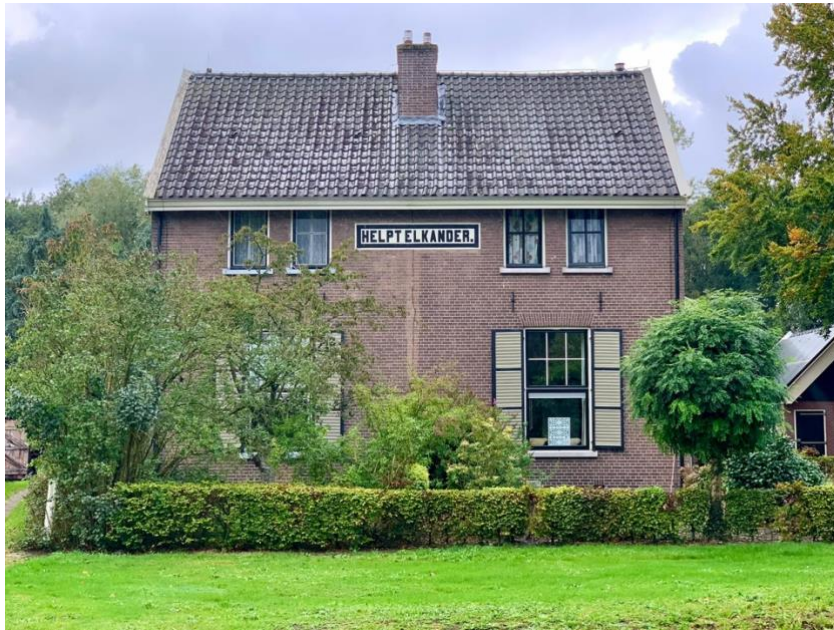
Een huis in Veenhuizen

Bij het ter perse gaan van dit jaarverslag is inmiddels bekend gemaakt dat het Ensemble Veenhuizen door het Rijksvastgoedbedrijf wordt overgedragen aan het consortium. Direct aansluitend zal het vastgoed worden overgedragen aan de daartoe opgerichte stichting 'De Nieuwe Rentmeester'. Met het vastgoed in deze stichting wordt het behoud van het ensemble gewaarborgd. De NMo beheert geen vastgoed en zal daarom ook geen zitting nemen in het Bestuur van de stichting. Met de overdracht is een belangrijk, monumentaal ensemble – dat mogelijk in 2021 deel zal gaan uitmaken van het Wereld Erfgoed – als geheel bewaard.